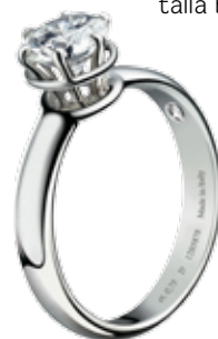
Minou Ring de Damiani, solitario de oro blanco y diamante talla brillante 1.720€