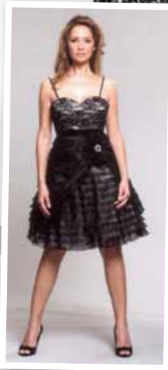
Vestido corto 374,50€, Boutique Patricia