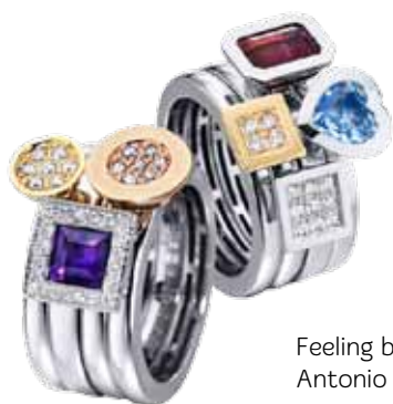
Feeling by Antonio Soria con corazón 2.492€, sin él 2.304€

En las fechas más entrañables del año refugian con luz propia los materiales y piedras más nobles: oro, plata, diamantes, zafiros, ónix, jade... una constelación de estrellas trabajadas y engarzadas con maestría en innovadores diseños destinados a realzar la belleza de quien las posee.