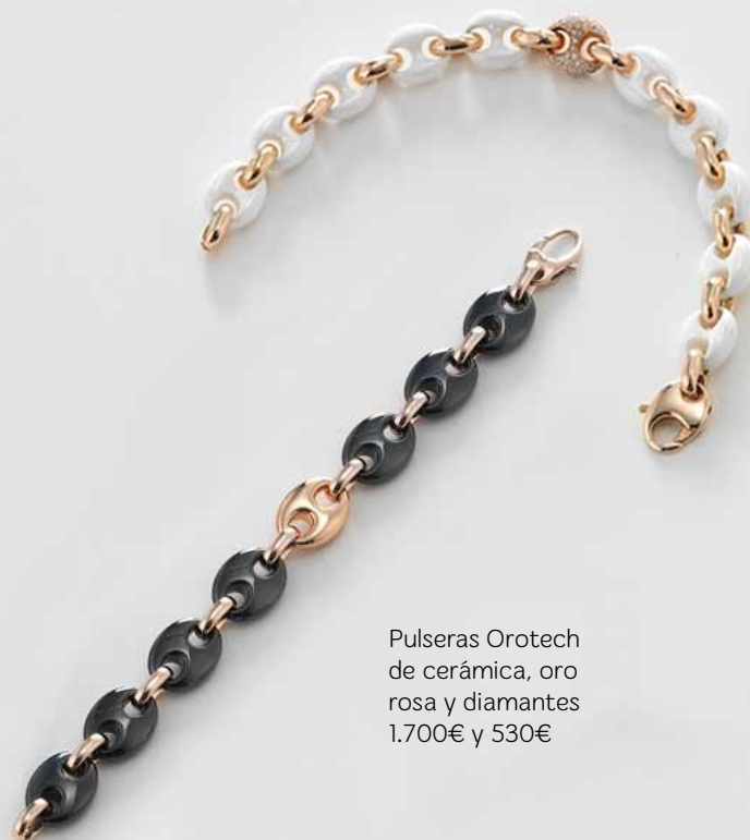
Pulseras Orotech de cerámica, oro rosa y diamantes 1.700€ y 530€