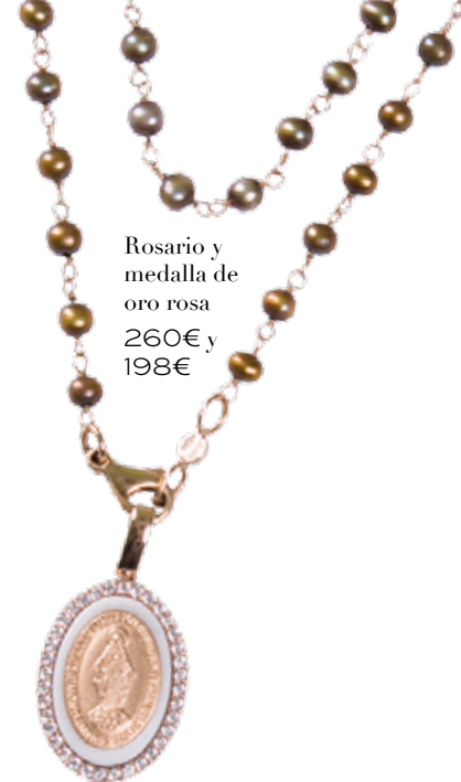
Rosario y medalla de oro rosa 260€ y 198€

Estilo londinense, un toque militar con americanas y parkas. Piezas cómodas, urbanas y versátiles para poder ir tanto a la oficina como a una cena. Más los complementos idóneos para un look rompedor. Querrás tenerlos todos!