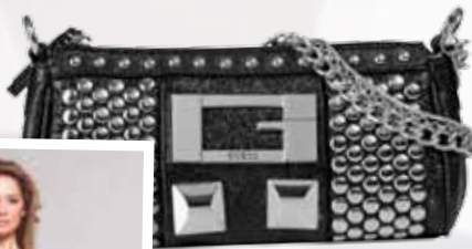
Guess 114€, en Amelia