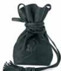
Plata de Palo 80€