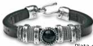
Plata de Palo 251€