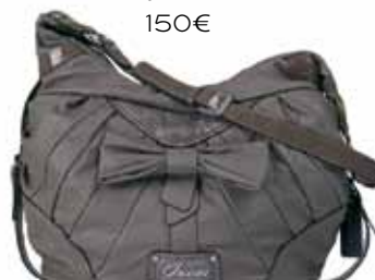
Guess en AMELIA 150€