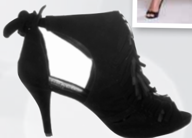
Sándalo 113€, en Amelia