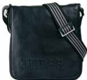
Guess en AMELIA 94€