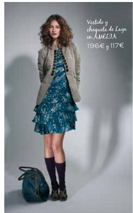
Vestido y chaqueta de Laga en AMELIA 196€ y 117€