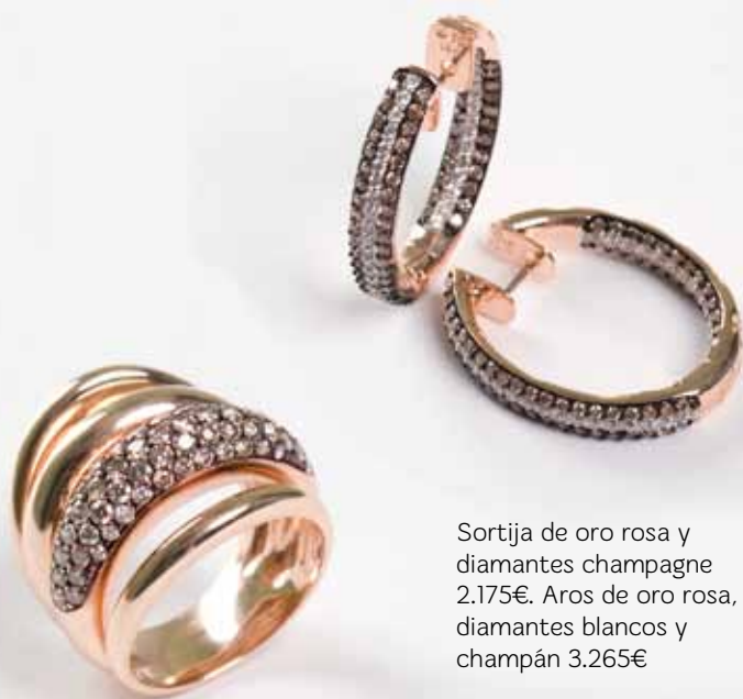
Sortija de oro rosa y diamantes champagne 2.175€. Aros de oro rosa, diamantes blancos y champán 3.265€