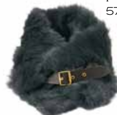
Cuello y guantes de piel en AMELIA 57€ y 37€