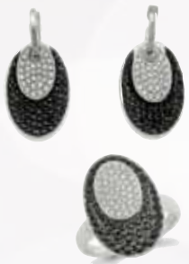
Pendientes y sortija Jovima de oro blanco y diamantes 2.596€ y 1.321€