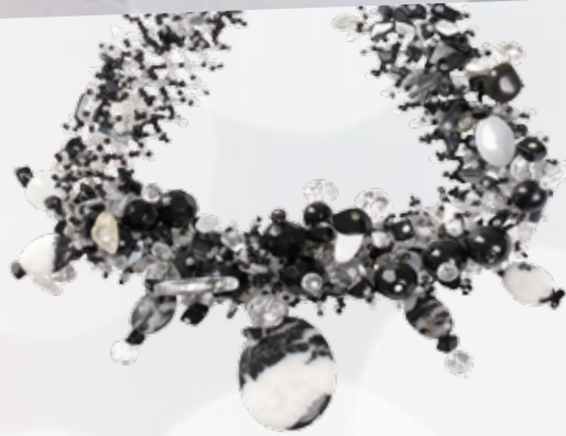
Collar de piedras naturales I.Valiente 100€, en Amelia