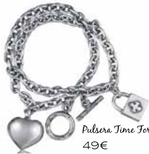
Pulsera Time Force 49€

¡Vuelve lo clásico! Básicos que puedes llevar una y otra vez combinándolos sin que parezca que repites look. Puntos, tejidos naturales y salvajes con complementos dorados inundarán tu armario. ¡Todo muy urban!