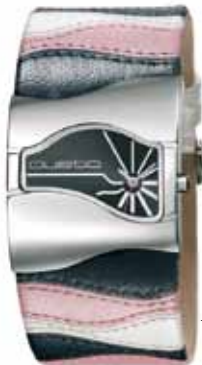
Custo en AMELIA 158€