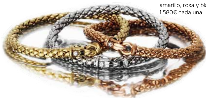
Pulseras Chimento de oro amarillo, rosa y blanco 1.580€ cada una