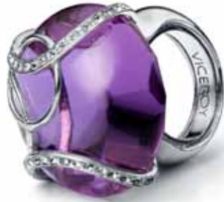
Viceroy de plata rodiada y cristal 149€