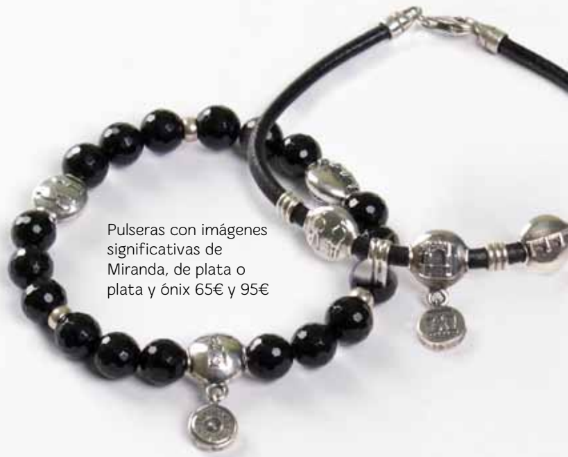
Pulseras con imágenes significativas de Miranda, de plata o plata y ónix 65€ y 95€