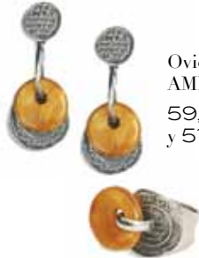
Ovio, en AMELIA 59,50€ y 51,50€