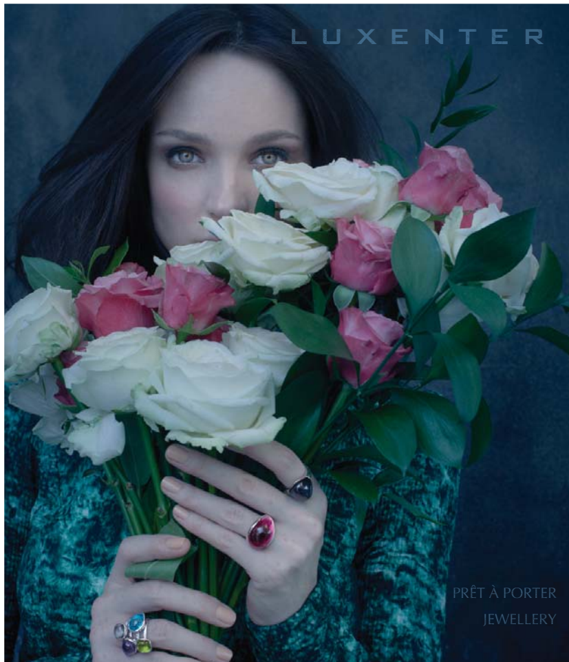
Campaña Otoño/Invierno 2010. Kariba