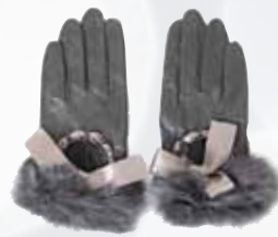
Guantes piel 50€, en Amelia