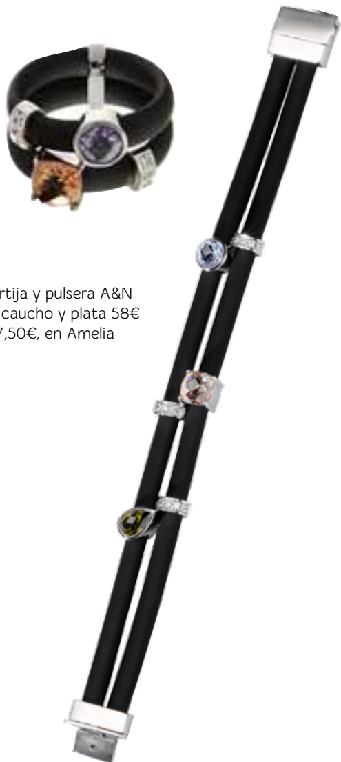
Sortija y pulsera A&N de caucho y plata 58€ 107,50€, en Amelia