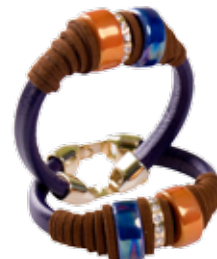
Valiente en AMELIA 60€/und