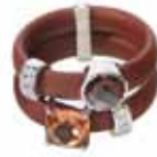
A&N en AMELIA 58€