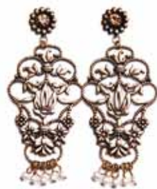
Pendientes y collar Laga en AMELIA 62€ y 39€