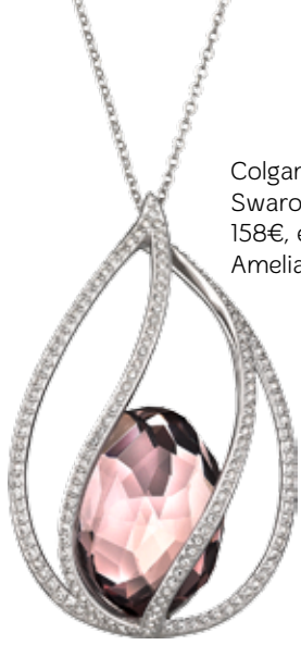
Colgante Swarovsky 158€, en Amelia