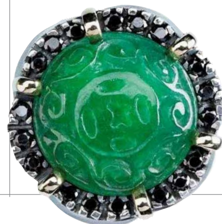
Pekan sortija de plata, oro, espinelas negras y jade 398€