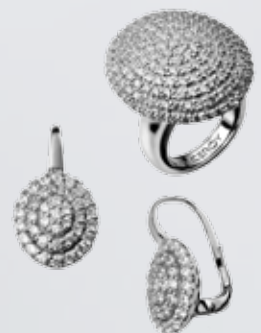
Anillo y pendientes Viceroy de plata rodiada 119€ y 189€