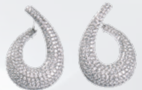
Centoventuno oro blanco y diamantes 9.640€