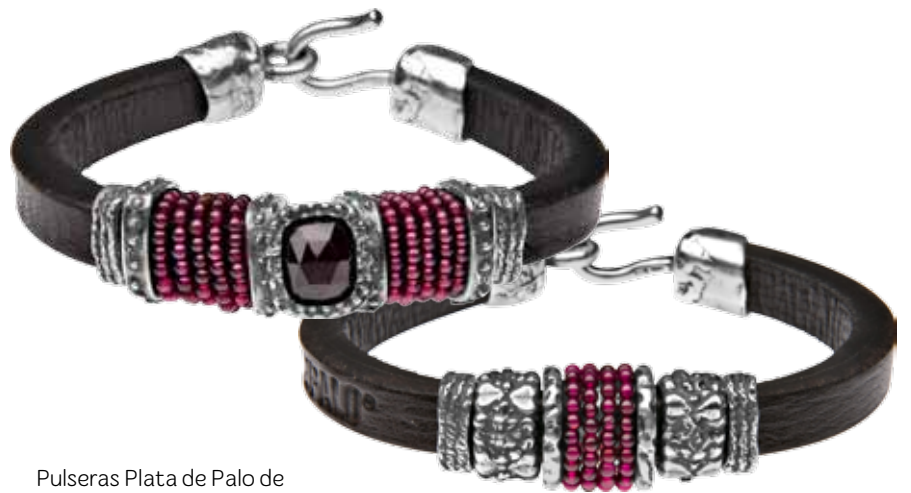
Pulseras Plata de Palo de cuero, plata, granates y ónix 188€ y 175€