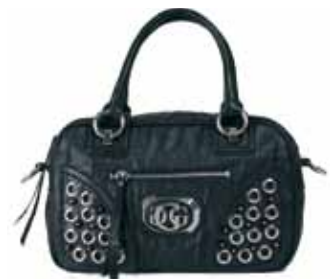
Guess en AMELIA 158€