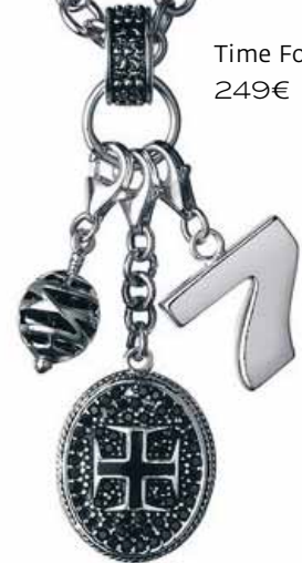
Time Force 249€