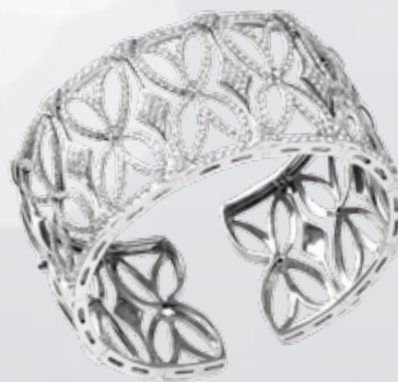
Brazalete de oro blanco y diamantes 12.450€