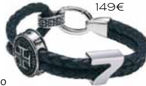
Time Force 149€