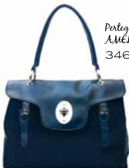
Perlegaz en AMELIA 346€