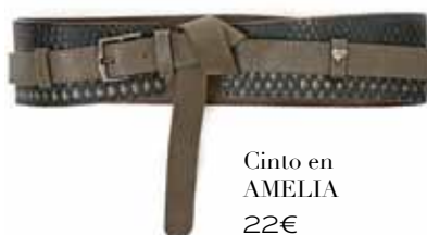
Cinto en AMELIA 22€