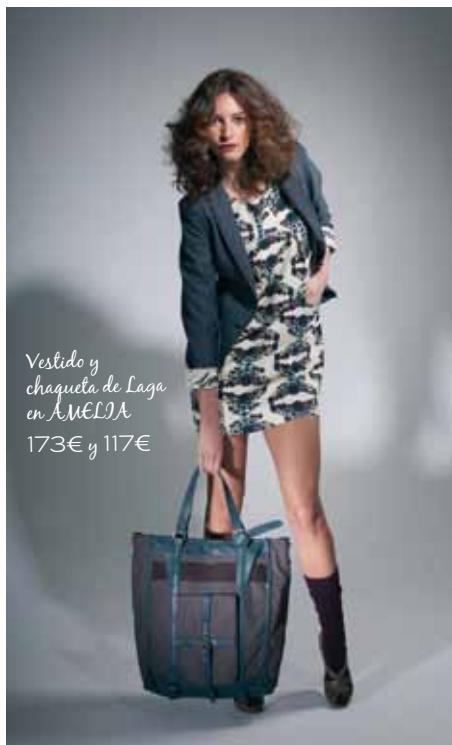
Vestido y chaqueta de Laga en AMELIA 173€ y 117€