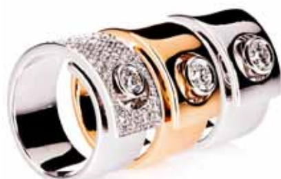
Roca de oro blanco con pavé, oro rosa y oro blanco con diamante 1.405€, 885€ y 946€