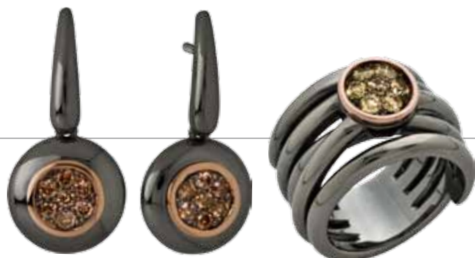
Sortija y pendientes Jesús García de plata rutelada, oro rosa y brillantes champagne 385€ y 407€