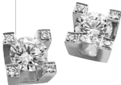
Jesús García de oro blanco y diamantes, desde 1.170€