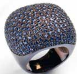
Sortija Vento de plata negra y zafiros azules 490€