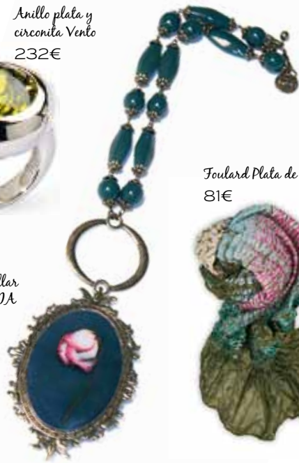
Foulard Plata de Palo 81€