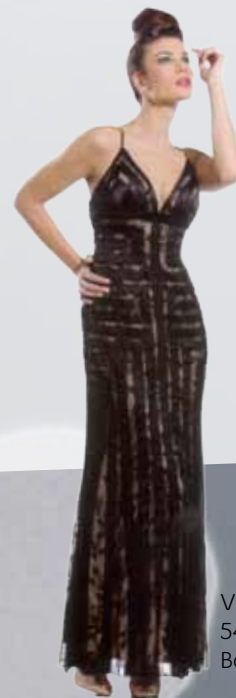
Vestido largo 547,50 €, Boutique Patricia